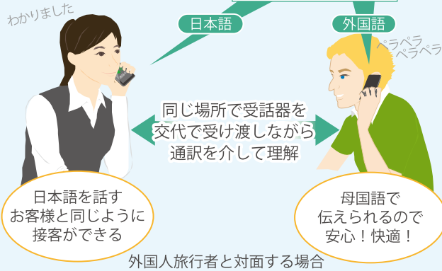
外国人旅行者と対面する場合

電話通訳は、外国人旅行者と対面する場合、外国人旅行者から連絡があった場合又は外国人旅行者に連絡を取りたい場合に、コールセンターを通して通話を行うサービスです。