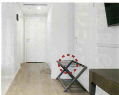
ベッドの隙間・ラゲッジスペースなどに噴射。