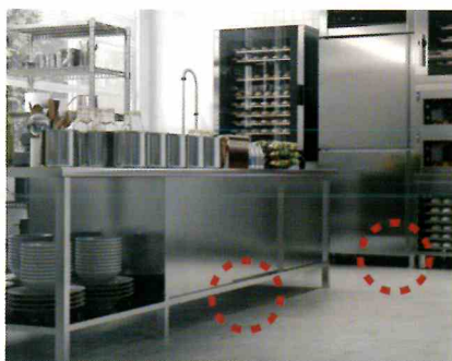
冷蔵庫・食器棚の裏側などに噴射。